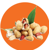
ถั่วลิสง (Peanut)