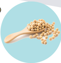
ถั่วเหลือง (Soy)