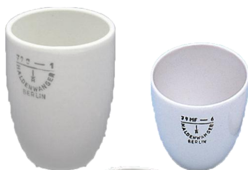
Crucible / Berlin