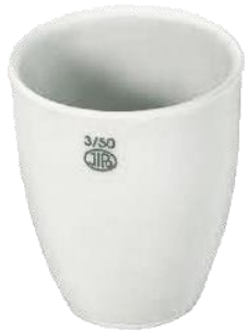
Crucible JIPO สูง