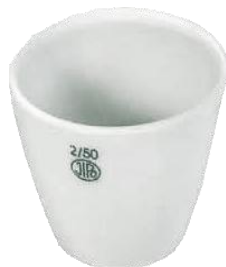
Crucible JIPO กลาง