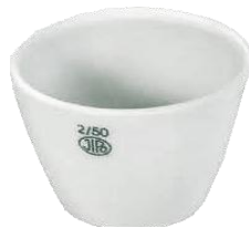
Crucible JIPO เตี้ย