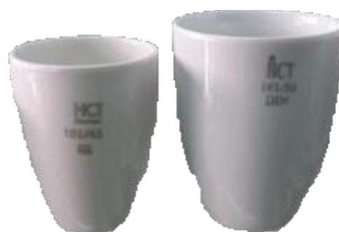
Crucible / HCT / German